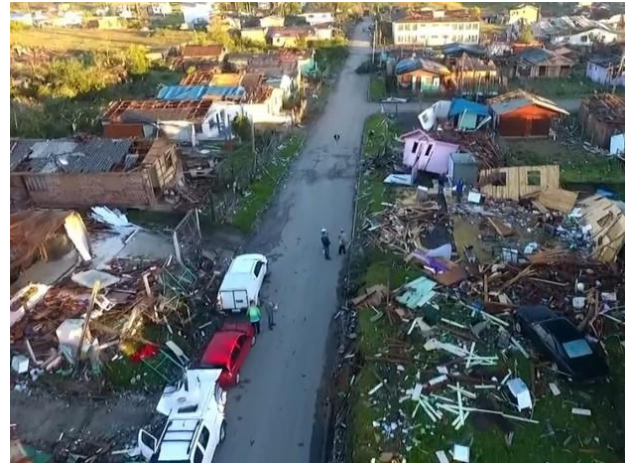
São Francisco de Paula – Tornado - 2017

http://g1.globo.com/rs/rio-grande-do-sul/noticia/2017/03/estragos-em-sao-francisco-de-paula-sao-compativeis-tornado-diz-inmet.html