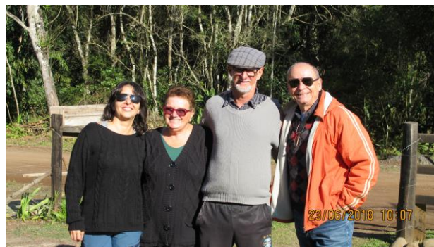
2018 - Curso de Gestão de Riscos de Desastres Barra do Ouro – Maquiné/RS