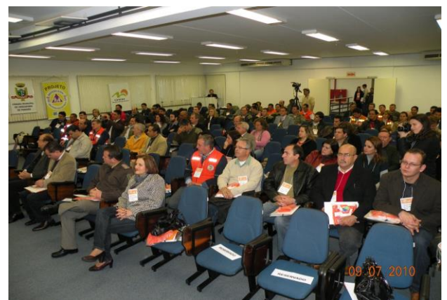
I Encontro Regional – Taquara – 2010

I ENCONTRO REGIONAL DE DEFESA CIVIL com vista a elaboração do “Diagnóstico Preliminar da situação de cada um dos 11 municípios sob o ponto de vista da gestão de riscos e de desastres” – Taquara/RS;