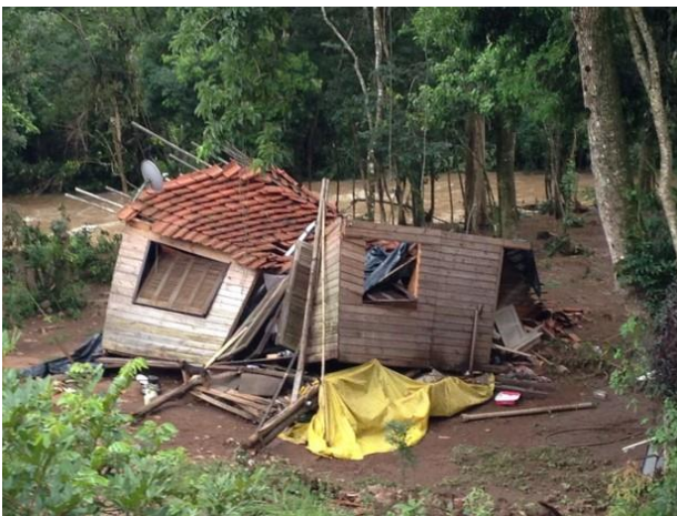
Rolante – 2017 – Enxurrada

Além dos impactos diretos e indiretos sobre a produção e o emprego, dentro do complexo agroindustrial, são observados impactos indiretos, que ocorreram em setores não ligados à agropecuária, como segmentos do setor terciário (administração pública, instituições financeiras e outros) decorrentes da variação da circulação da renda na economia (FOCHEZATTO e GRANDO, 2009).