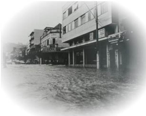
Centro de Taquara – 1978 Inundação

As ameaças de EVENTOS NATURAIS SEVEROS ou provocados pelo homem ( ANTROPOGÊNICOS ), a cada dia, revelam-se com maior magnitude e intensidade, exigindo um conjunto de competências, habilidades e aptidões do gestor e do servidor público .