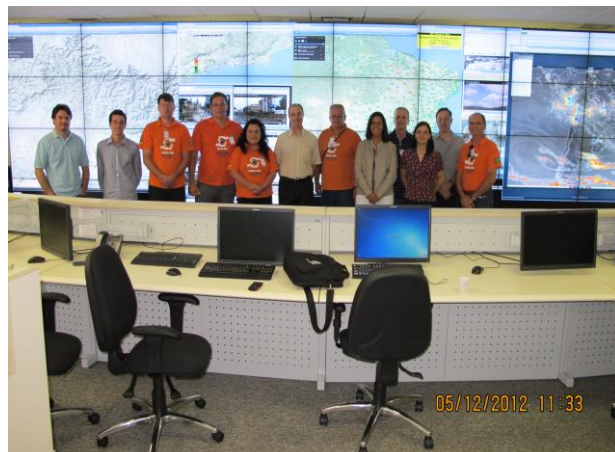
Visita técnica e apresentação de Seminário no CEMADEN 2012 Cachoeira Paulista - SP