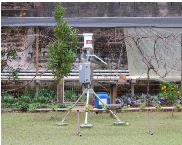
Estação Meteorológica – Três Coroas