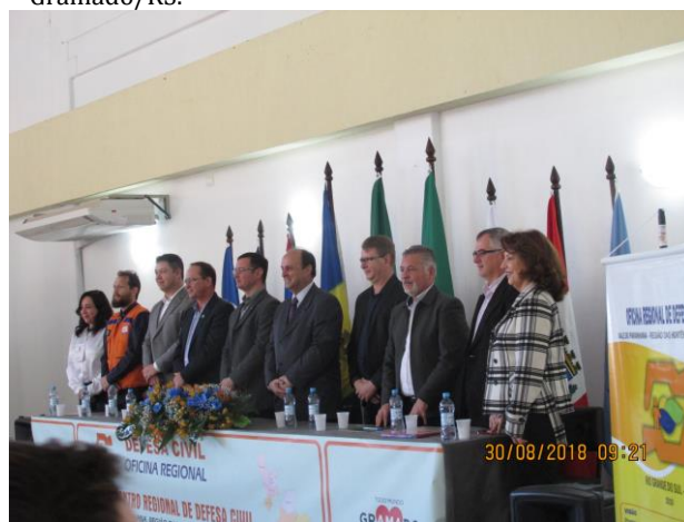
2018 - Solenidade de abertura do IX Encontro Regional Mesa de Honra