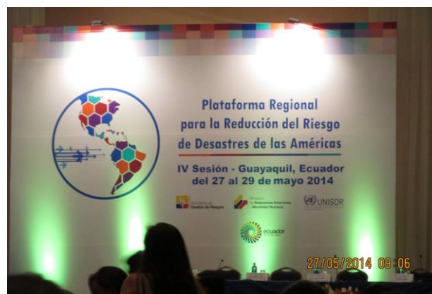
Participação em eventos internacionais para apresentar a metodologia de trabalho – Guayaquil - Equador - 2014