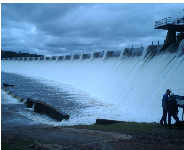
Barragem do Salto – São Francisco de Paula – 2010

com elaboração e encaminhamento de Moção à Sra. Governadora para criação de uma regional que abrangesse os 11 municípios; - Estabelecimentos de interações e ações para a elaboração de um Plano Regional; - Aprovação Quadro de Trabalho Quinzenal e Cronograma da 1ª Fase do projeto; - Estabelecimento da Metodologia das Oficinas de Diagnóstico e Planejamento inicial sobre a localização das Estações Pluvio-hidrológicas.