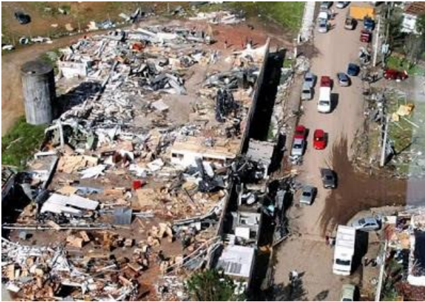
Canela – 2010 – Tornado

489 casas afetadas, sendo 408 estão danificadas e 81 destruídas