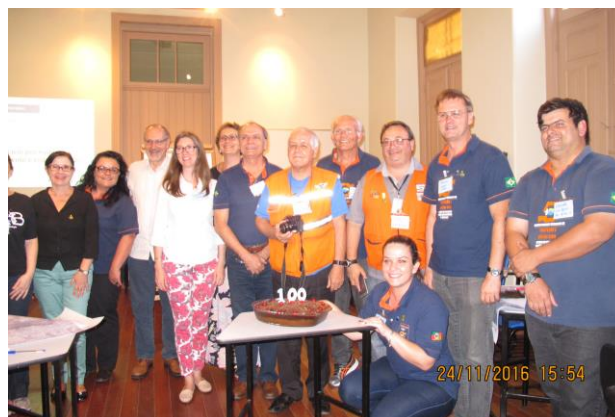
100ª Sessão de Capacitação e Planejamento em conjunto com o CEPED/UFRGS