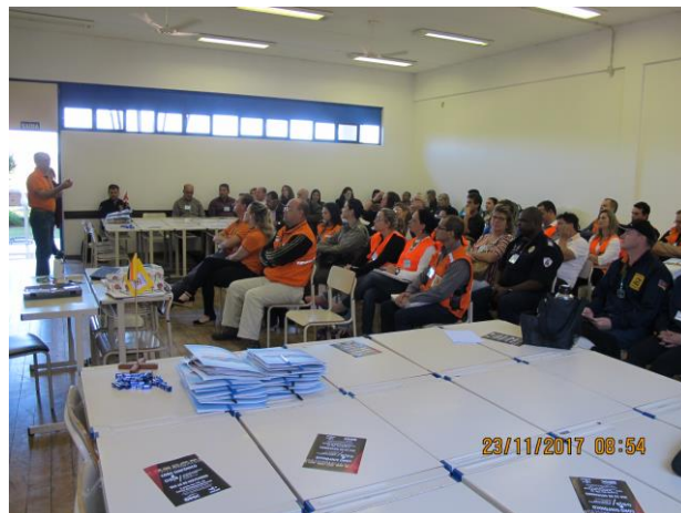
2017 - Capacitação em Canela Parceria CREA – AEA - FACCAT