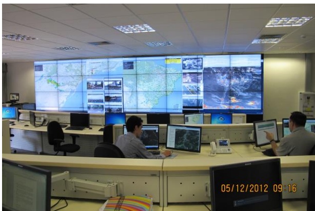
Seminário em conjunto com o CEMADEN Cachoeira Paulista – SP – 2012