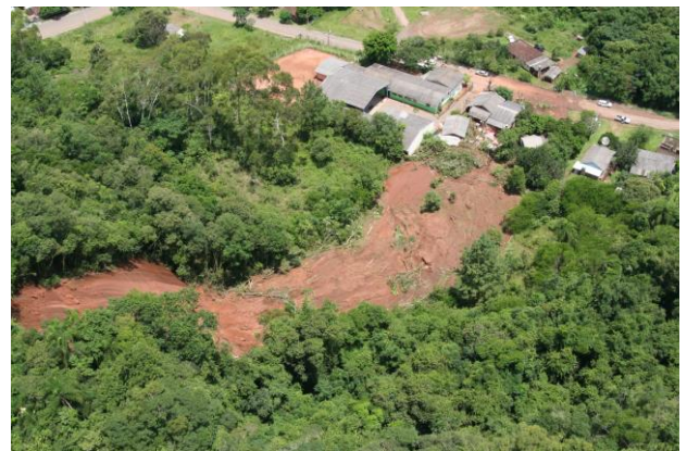
Três Coroas – Deslizamento de encosta – 2010

No contexto da gestão de risco de desastres no Rio Grande do Sul, os eventos de estiagem também são significativos. Ainda segundo dados da Defesa Civil estadual, entre os anos de 2003 e 2010, alagamentos, enxurradas e inundações em conjunto perfazem um total de 31% dos eventos registrados, enquanto os de estiagem correspondem a 69% do conjunto de desastres no Estado.