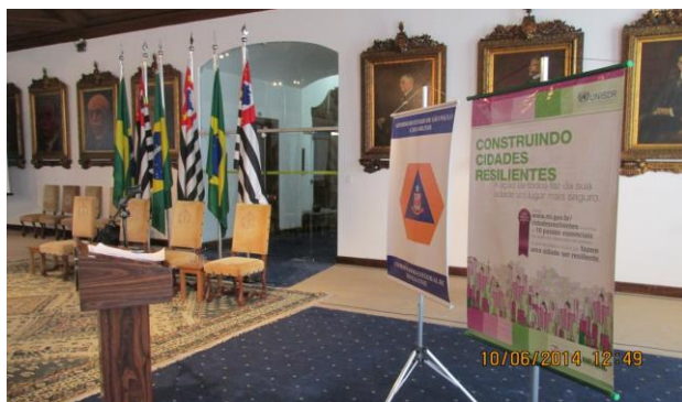
Adesão ao Programa Mundial da ONU – Cidades Resilientes