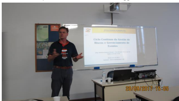
FEEVALE – Painéis de GRD