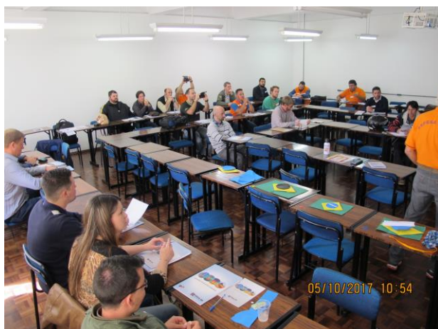
Capacitação em Canela Parceria CREA – AEA - UCS