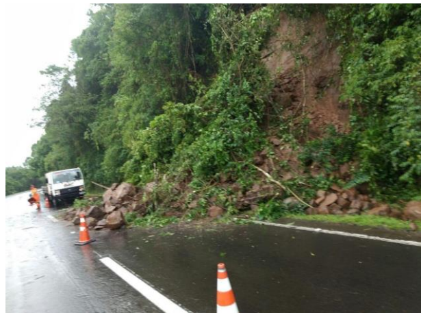
ERS 239 – Três Coroas – 2015 Deslizamento de encosta

Segundo informações do Centro de Pesquisa em Epidemiologia de Desastres, da Organização Meteorológica Mundial , nos últimos dez anos 1.083 pessoas perderam a vida em decorrência de desastres no território nacional.