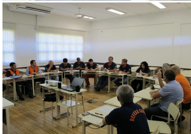
Sessões sistemáticas de estudo e planejamento