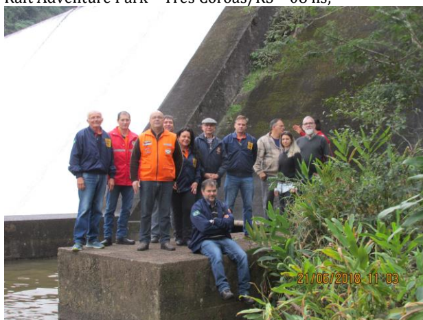
2018 – Minicurso “Segurança de Barragens” Barragem das Laranjeiras – Três Coroas