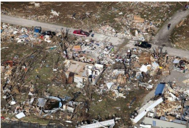
São Francisco de Paula – Tornado - 2003

A queda de produção provocada pela estiagem, no setor agrícola, que afeta principalmente as lavouras de soja, fumo, milho e feijão (60% das lavouras temporárias), produz efeitos que se refletem sobre todo o conjunto da economia estadual, dada a interligação dos segmentos agroindustriais a outros setores da matriz produtiva, voltados tanto para o mercado interno como para o externo.