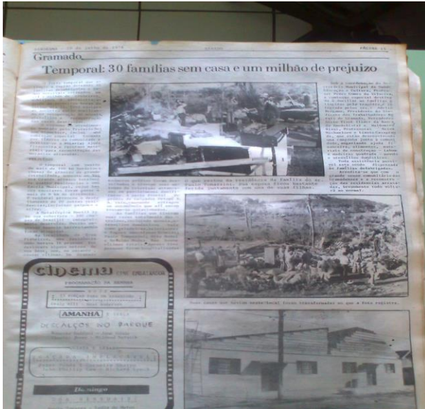
Gramado – Vendaval e Granizo 1978

A queda de produção provocada pela estiagem, no setor agrícola, que afeta principalmente as lavouras de soja, fumo, milho e feijão (60% das lavouras temporárias), produz efeitos que se refletem sobre todo o conjunto da economia estadual, dada a interligação dos segmentos agroindustriais a outros setores da matriz produtiva, voltados tanto para o mercado interno como para o externo.