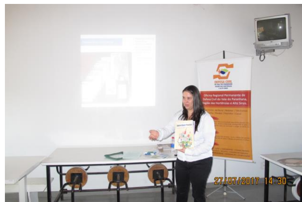
Capacitação com participação de especialistas