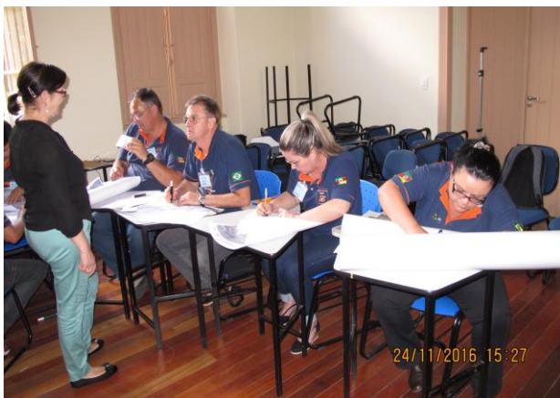
Parceria e capacitação com Centros de Pesquisa e estudos especializados CEPED/UFRGS