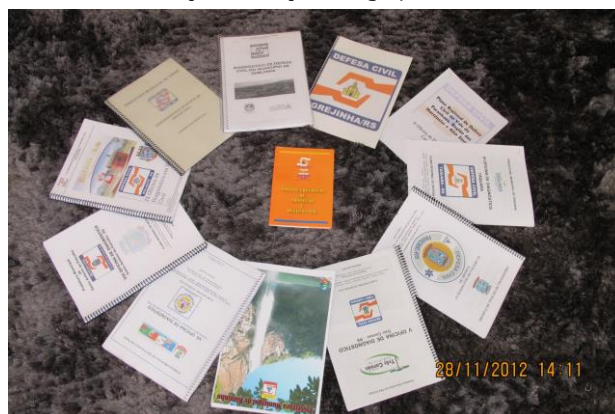
Diagnóstico estrutural de cada município Importante ferramenta de gestão do risco