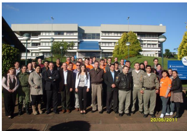
Curso de Capacitação em Sistemas de Comando de Operações (SCO) – FACCAT – Taquara 2011