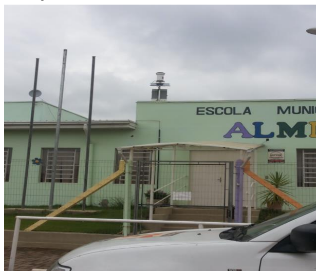
Pluviômetro em escola – Igrejinha