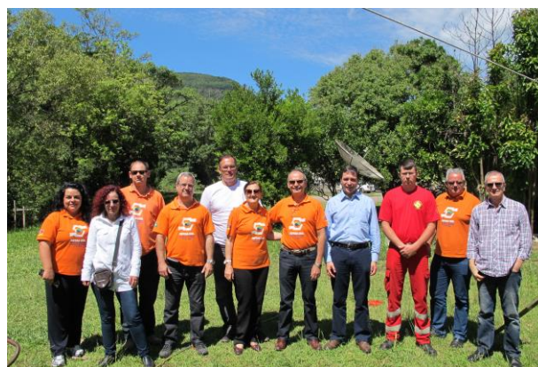
Inspeção Técnica Estações Meteorológicas – Três Coroas CEPSRM/UFRGS – CEMADEN