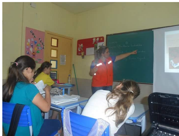
Prevenção de risco de desastres nas escolas