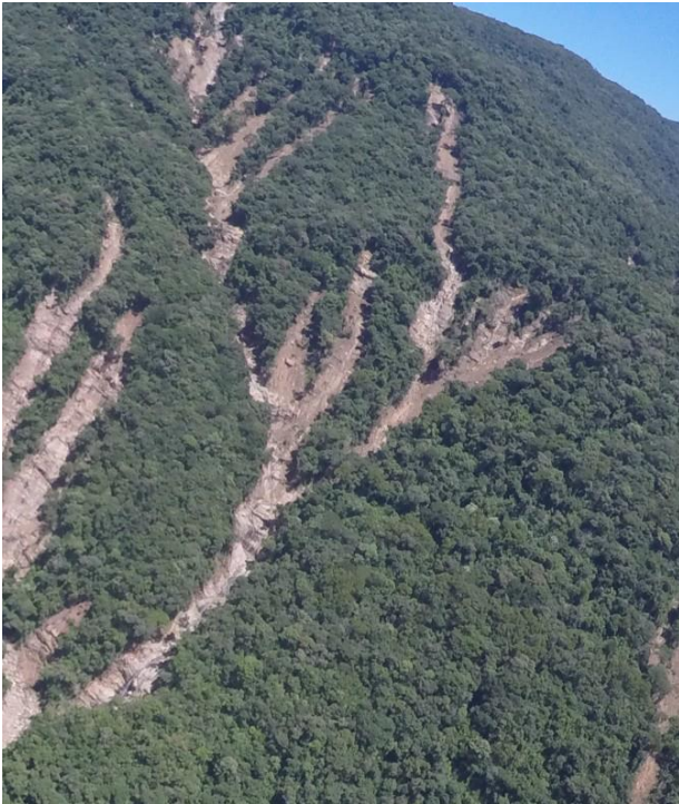
Rolante - 2017 – Formação de fluxo de detritos