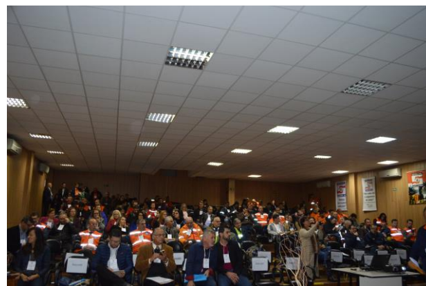
VIII Encontro Regional Santo Antônio da Patrulha