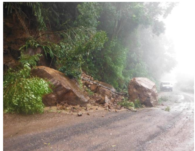
Igrejinha – 2015 – Quedas de blocos

http://g1.globo.com/rs/rio-grande-do-sul/noticia/2017/03/estragos-em-sao-francisco-de-paula-sao-compativeis-tornado-diz-inmet.html