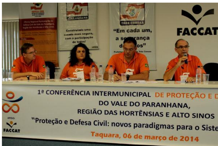
Defesa Civil de Carará participa da organização da 1ª Conferência Intermunicipal de Proteção e Defesa Civil do Vale do Paranhana, Região das Hortênsias e Alto Sinos