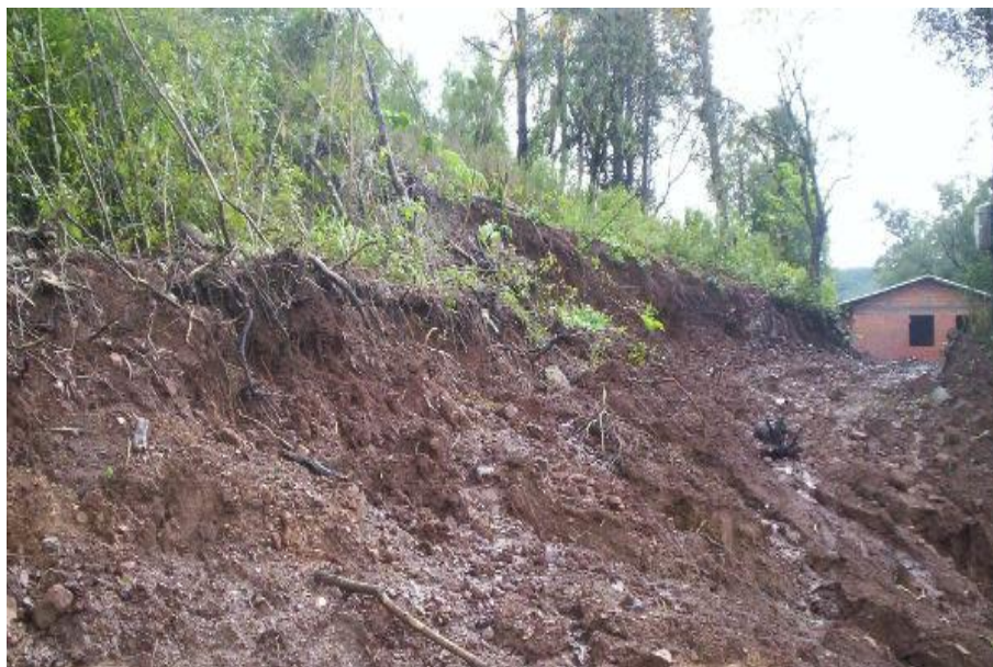
DESLIZAMENTO provocado por chuva extrema. Localidade Caraá Central. 2008