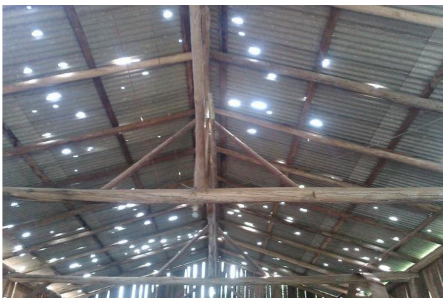
Dano provocado pelo GRANIZO. Localidade Espigão do Caraá - 2015