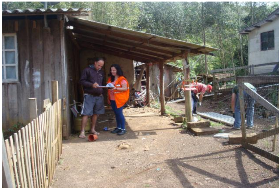
Entrega de AJUDA HUMANITÁRIA (telhas) a atingido pelo granizo. Localidade Alto Rio do Meio. 2015