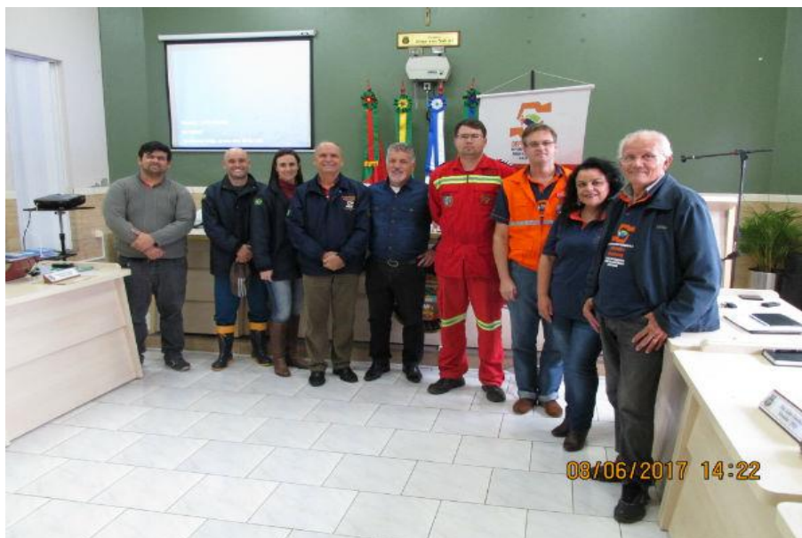
108ª Seção da Oficina Regional Permanente de Defesa Civil Realizada em Caraá dia 08/06/17