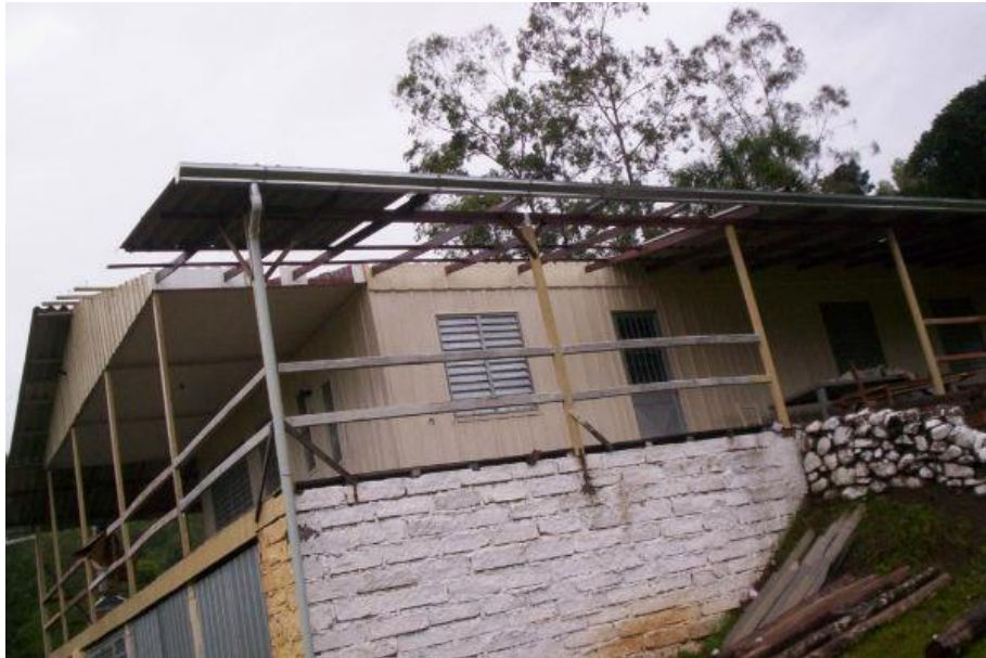
Dano provocado por VENDAVAL. Local Rua Pedro Machado de Borba. Ano 2009.