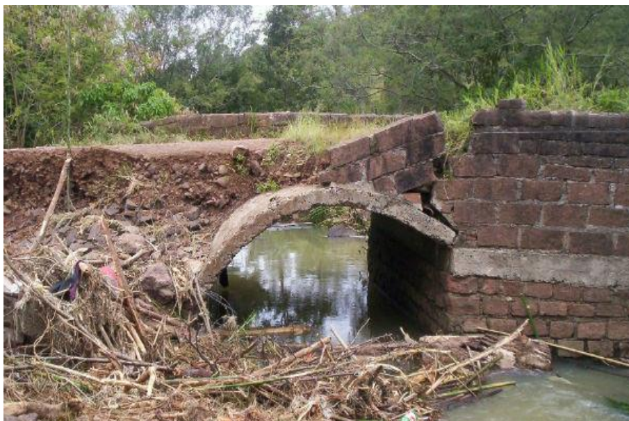
Dano de ENXURRADA em ponte. Localidade Divinéia - 2008