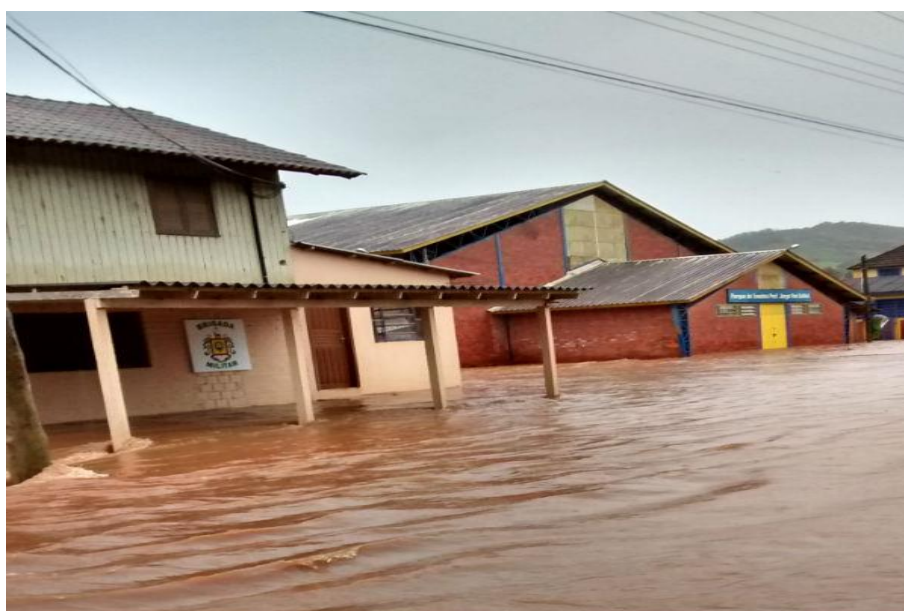
INUNDAÇÃO na área central do município. Sede da Brigada Militar e ginásio de esportes. Ano 2014