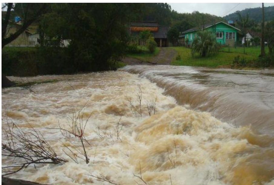
ENCHENTE no Arroio Caraá. Localidade Caraá Central - 2008