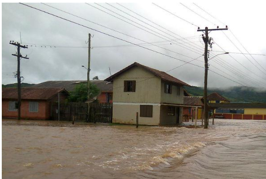
INUNDAÇÃO no centro da cidade, junto à antiga sede da administração municipal Ano 2013.